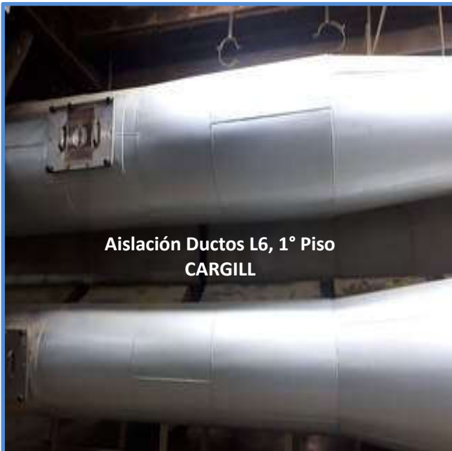
Aislación Ductos L6, 1° Piso CARGILL