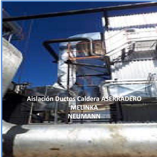
Aislación Ductos Caldera ASERRADERO MELINKA NEUMANN