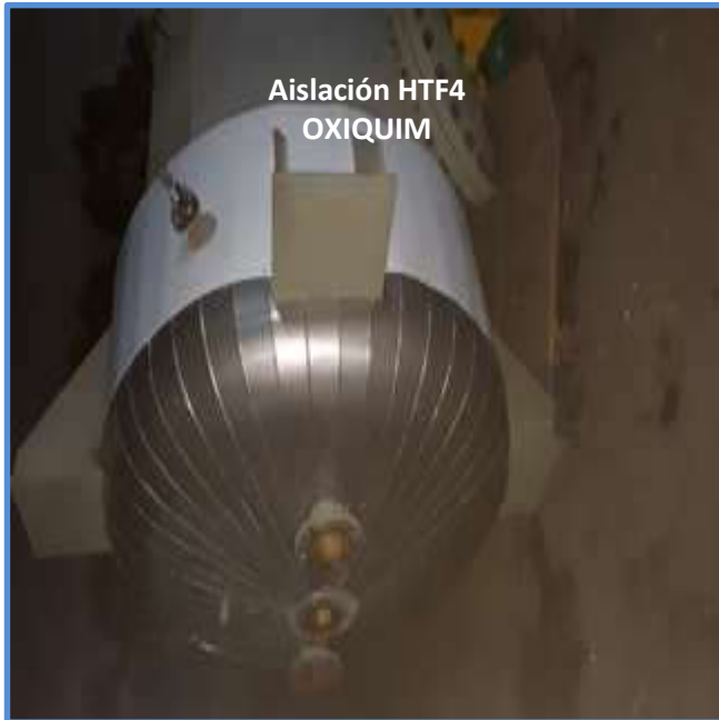
Aislación HTF4 OXIQUIM