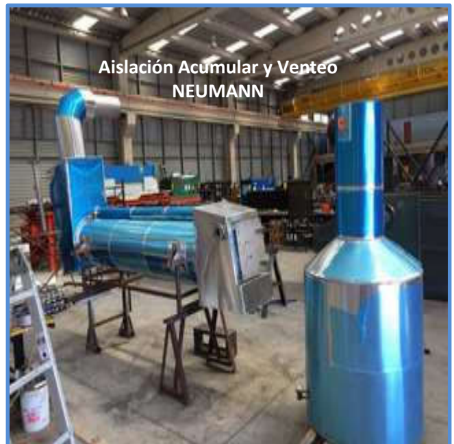
Aislación Acumular y Venteo NEUMANN