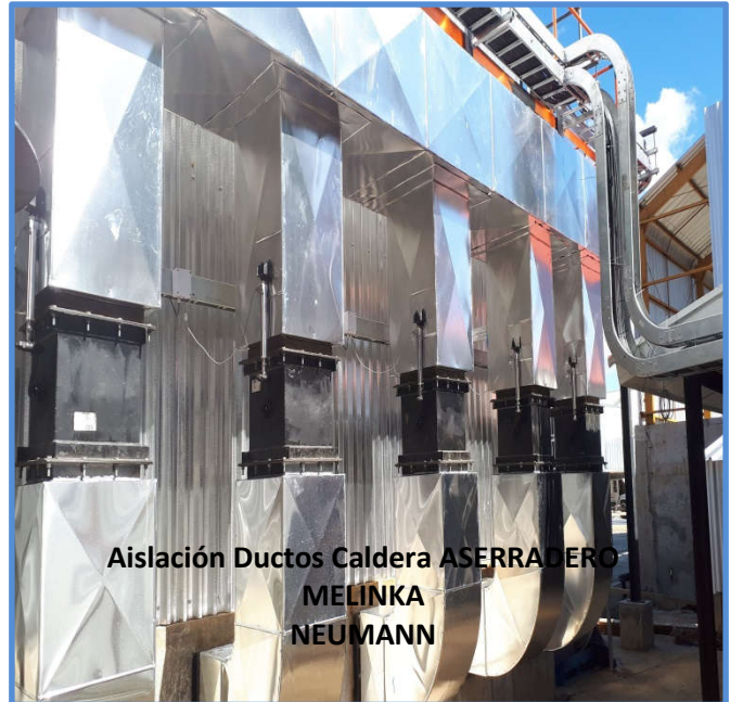
Aislación Ductos Caldera ASERRADERO MELINKA NEUMANN