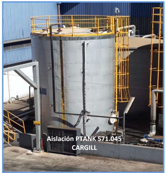
Aislación PTANK 571.045 CARGILL