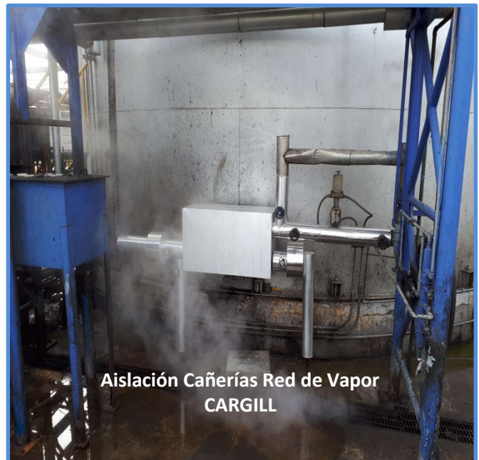
Aislación Cañerías Red de Vapor CARGILL